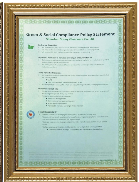
Grüne und soziale Verantwortung Policies Erklärung