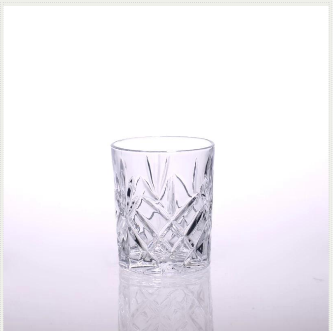
Kerzenhalter aus Glas Tasse