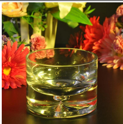
Kerzenhalter aus Glas Wassertropfen