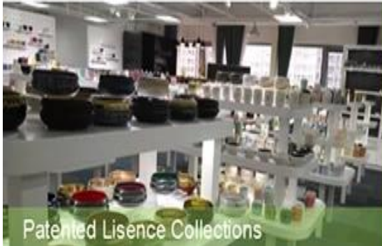
Patented License Collections