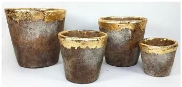
CS10025A-4 20.5x20.5x19.5cm CS10025B-4 17.5x17.5x16.5cm CS10025C-4 14.5x14.5x14cm CS10025D-4 11.5x11.5x10.5cm CS10025E-4 8x8x7cm