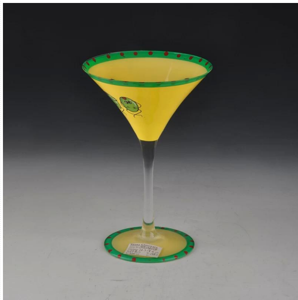
Hand bemalt Martini-Glas