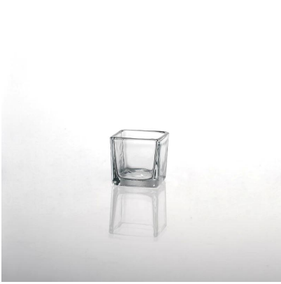
quadratischer Kerzenhalter aus klarem Glas