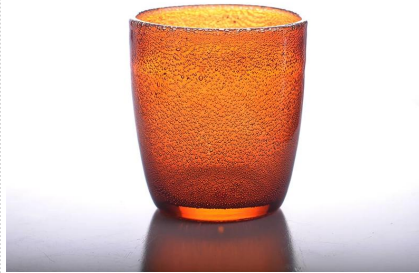
Blase farbigen Kerzenhalter aus Glas