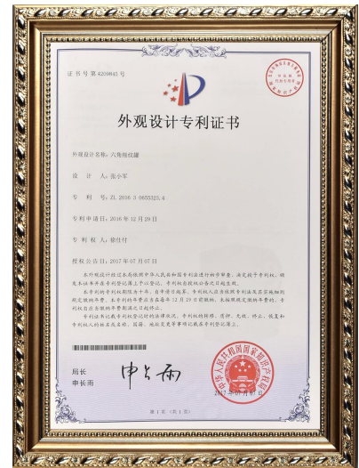
Patent Nr.: 201630655323.4