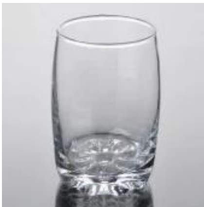
sunny Marke Trinkwasser Glastasse