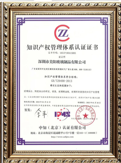
Intellektuelles Eigentum von Unternehmen Patent Nr.: 201630655323.4