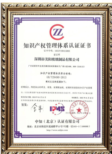
Geistiges Eigentum von Unternehmen Patent-Nr.: 201630655323.4