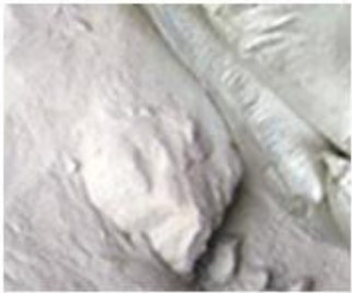
1、 Raw Material