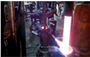
☐ Machin Pressed