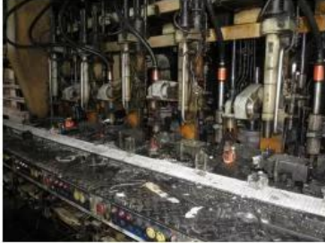
☐ IS Machine