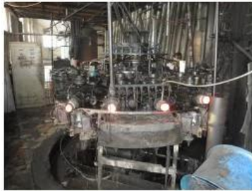
☐ Machine Blown