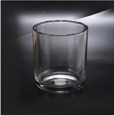
einzigartige Wohnkultur Spitze Spitzenhalter