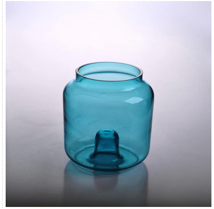
Neue Ankunft handgefertigte Glas-Kerzenhalter