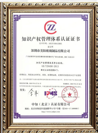
Intellektuelles Eigentum von Unternehmen Patent Nr.: 201630655323.4