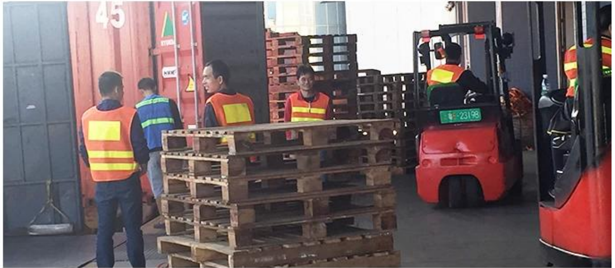
Own professional shipping company( Shenzhen Sunny Worldwide logistics)