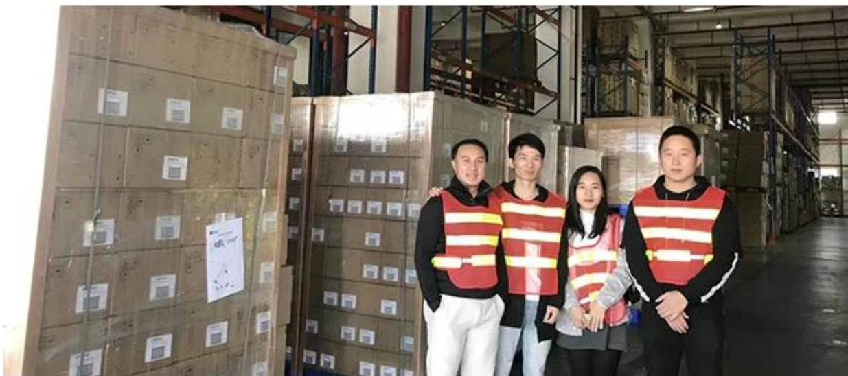
20+ years freight history and WCA members.