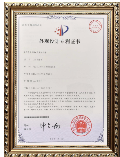
Patent Nr.: 20161630655323.4