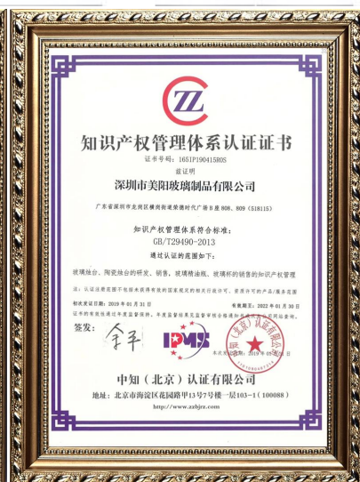
Intellectuelles Eigentum von Unternehmen Patent Nr.: 201630655323.4