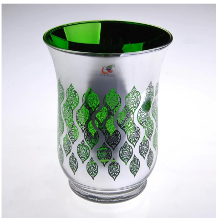
Green Tree Kerzenhalter aus Glas