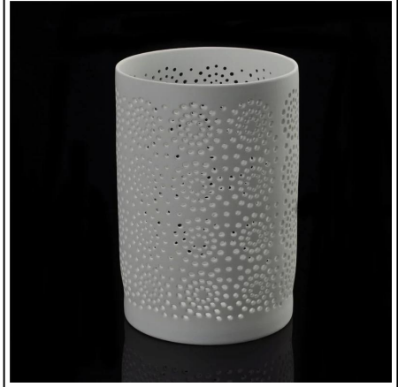
Matte weiße Keramik Kerze Glas Großhandel