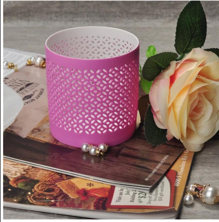
Schöne rosa hitzebeständig hohlen Keramik Kerze Jar