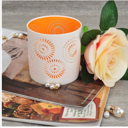
Keramik Kerze Glas Großhandel Innenraum lackiert