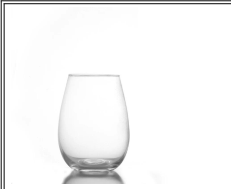
bestückte Maschine geblasen stemless Weingläser