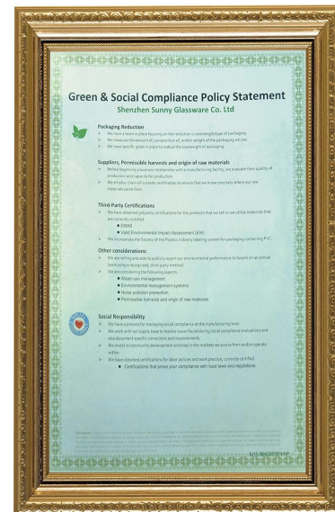
Grüne und soziale Verantwortung Polidys Aussage