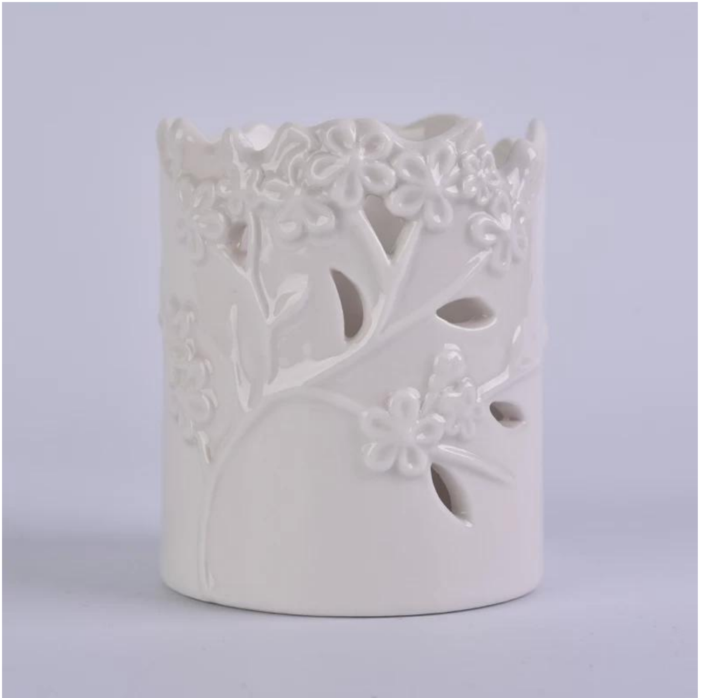
Andere Keramik Kerzenhalter