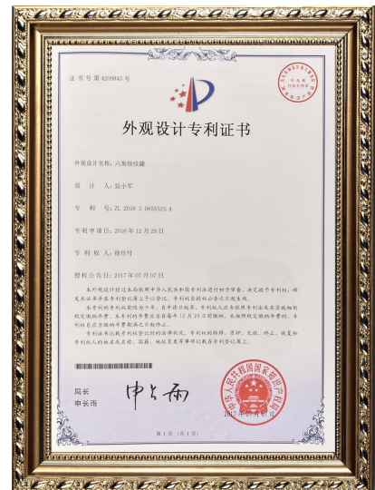
Patent n. 2.201630655323.4