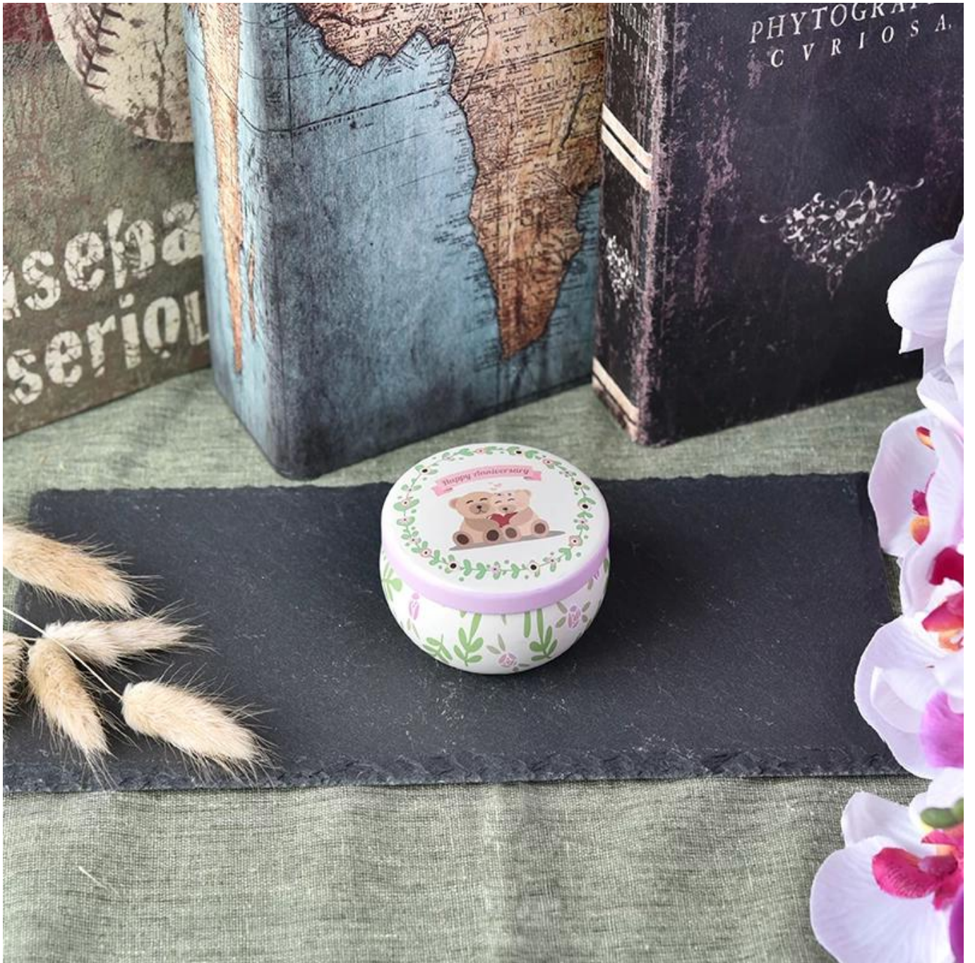
Office & Sample Room