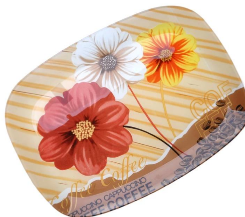
Glasplatte Rechteck verschmolzen