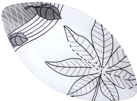
Glasplatte in Fisch Form verschmolzen