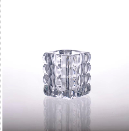
Platz Kerzenhalter aus Glas