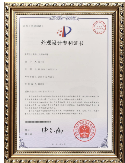
Patent n. 2.20163065523.4