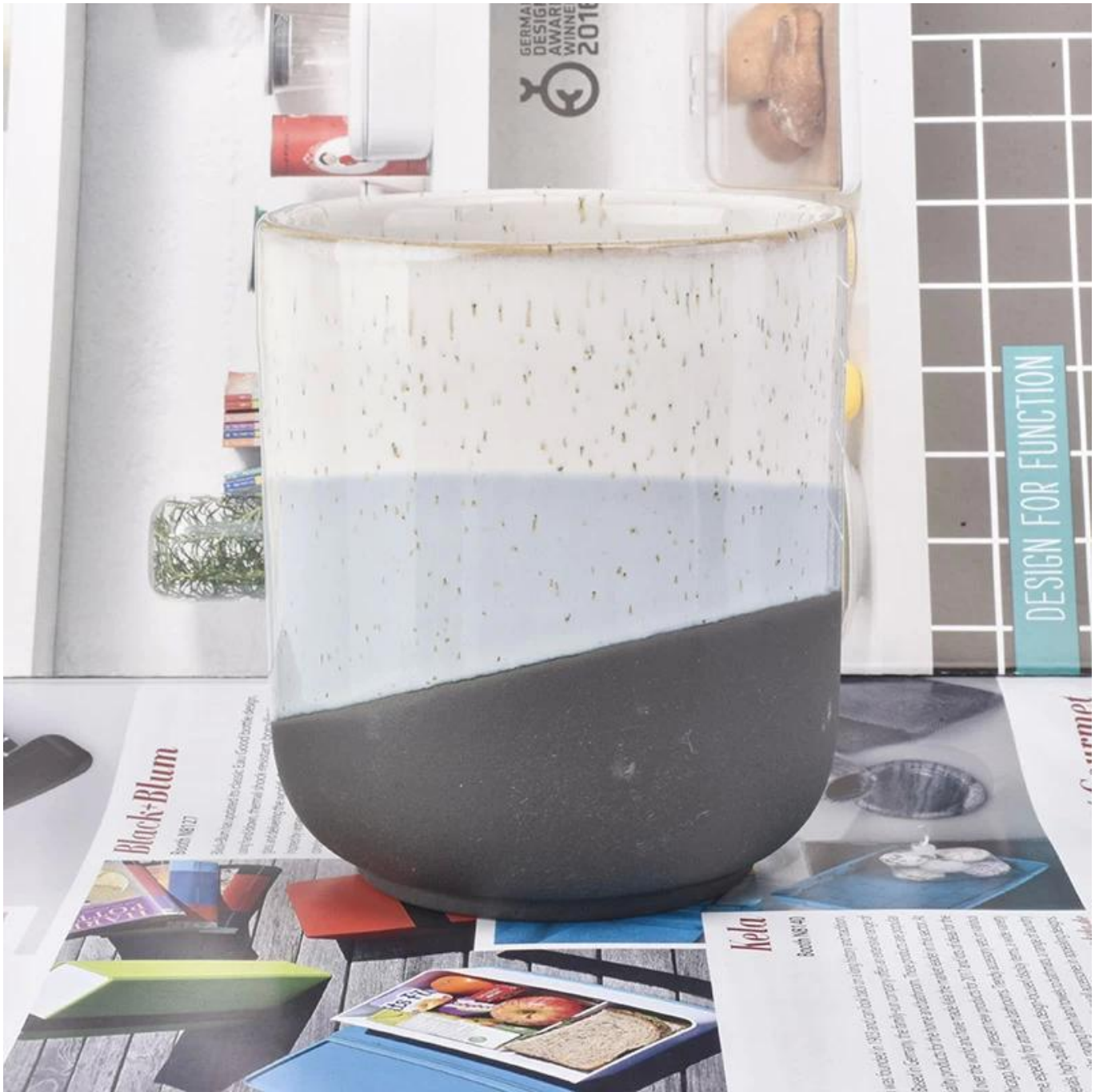
Office & Sample Room