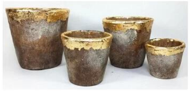
CS10025A-4 20.5x20.5x19.5cm CS10025B-4 17.5x17.5x16.5cm CS10025C-4 14.5x14.5x14cm CS10025D-4 11.5x11.5x10.5cm CS10025E-4 8x8x7cm