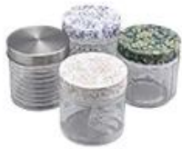
Metal with printing