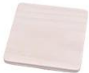
White pine wood lid