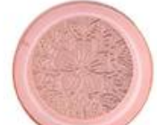
Zinc alloy embossed