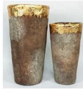
CS10024A-1 14x14x26cm CS10024B-1 11x11x20cm