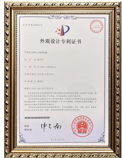
براءة اختراع رقم: 201630655323.4