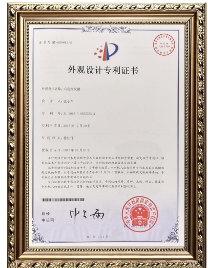
رقم براءة الاختراع: 201630655323.4