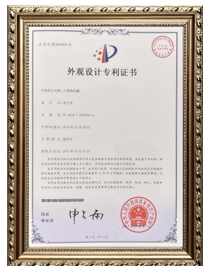
عدد براءات الاختراع: 201630655323.4