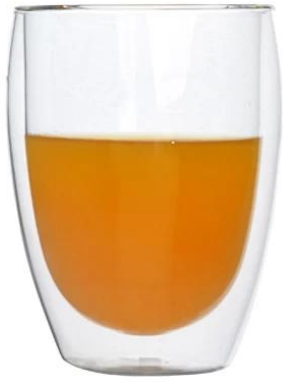
البورسيلكات زجاج مزدوج البهلوان 200ML