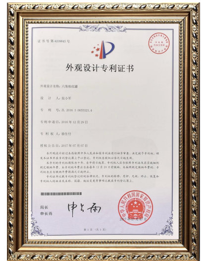
براءة اختراع رقم: 201630655323.4