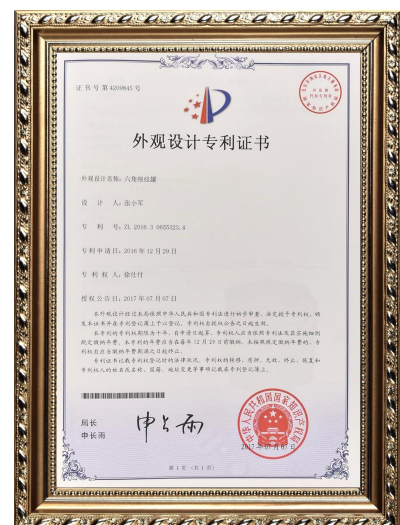
رقم براءات الاختراع: 201630655323.4