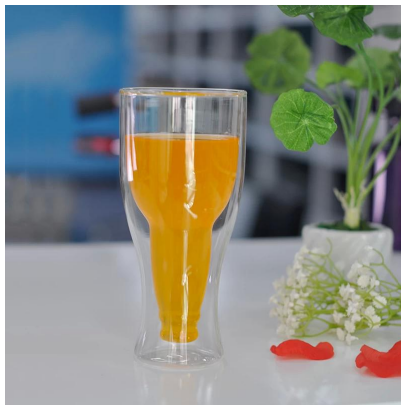
صنع الجدار الزجاج بوبل الجدار الزجاج بيره