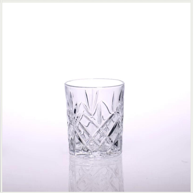
الزجاج حامل شمعة فنجان