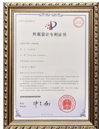
براءات الاختراع رقم: 201630655323.4