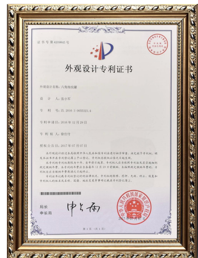
عدد براءات الاختراع: 201630655323.4