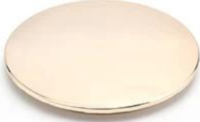
Zinc Alloy Cover