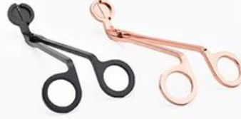
Wick Trimmer Cutter