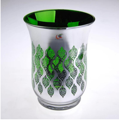
شجرة خضراء زجاج شمعة حامل