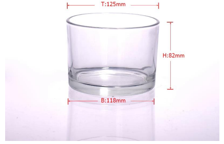
مربع واضحة جرة الزجاج شمعة