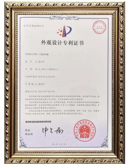
رقم براءة الاختراع: 201630655323.4