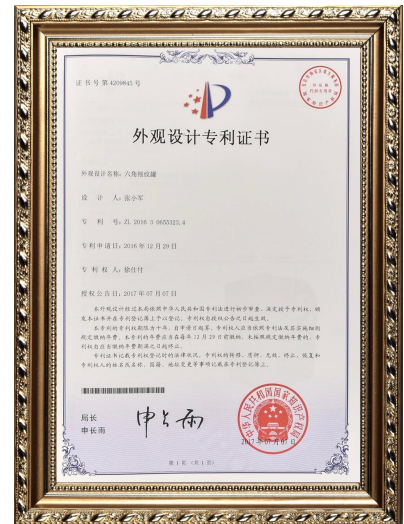
رقم براءة الاختراع: 201630655323.4