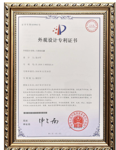
براءة الاختراع رقم: 20163065323.4