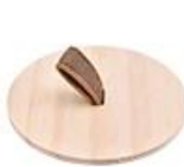
Pine wood lid