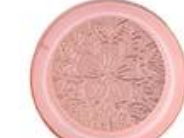
Zinc alloy embossed