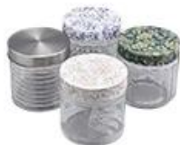
Metal with printing