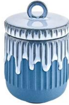
Ceramic Candle jar