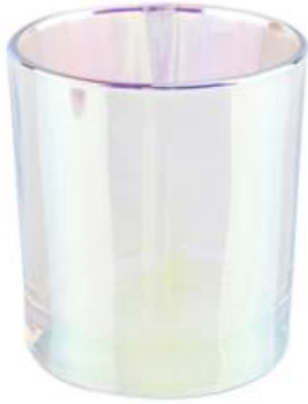
Glass Candle Vessel